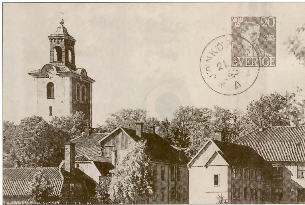
Ett maximikort med vy från Östra torget, eller Nya Torget som det hette då, och med Viktor Rydberg på frimärket - och med Jönköpingsstämpel. Kortet är från 1945.