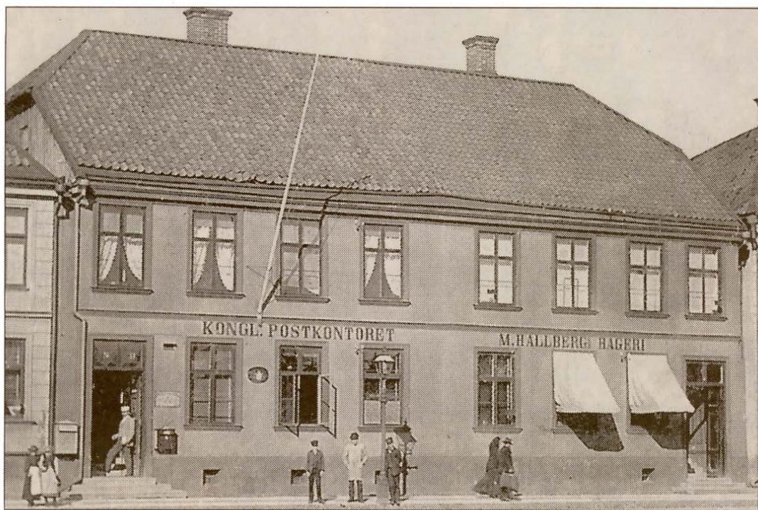
Kungliga postkontoret i Jönköping i slutet av 1800-talet, adress Östra Storgatan 33.